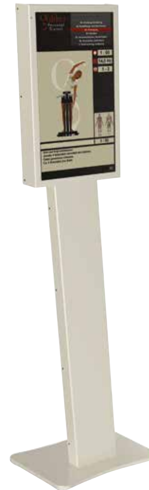
Galileo Med PT

VIDEOGESTÜTZTE THERAPIE AUF GROSSEM HDTV-MONITOR. INTUITIVE STEUERUNG DIREKT ÜBER DAS GALILEO BEDIENTEIL. KOMPLETTE CHIPKARTEN- UND OPTIONALE RFID-UNTERSTÜTZUNG BEI MED PT.