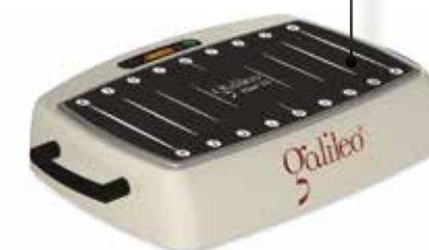
Galileo Med 35