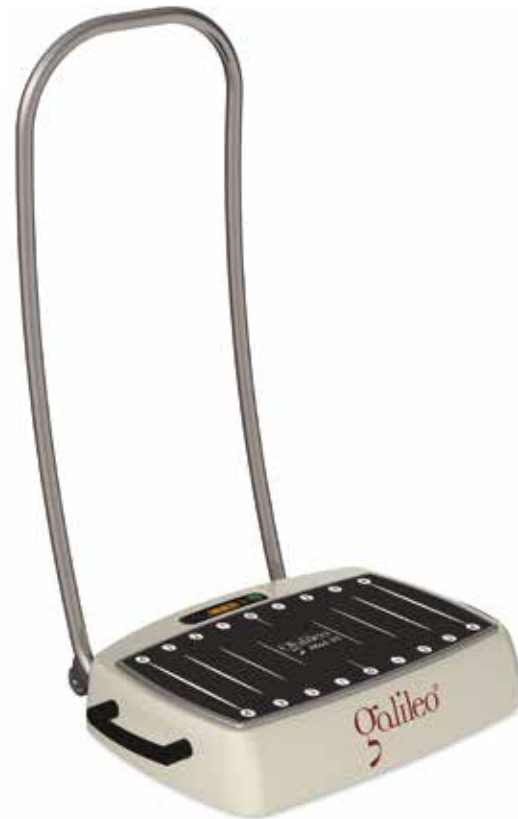
Galileo Med 35 mit Haltebügel mit integrierten Transportrollen

Der optionale Haltebügel kann insbesondere sturzgefährdeten Anwendern zusätzliche Sicherheit bieten. Er wird ohne großen Montageaufwand mit der Basiseinheit kombiniert, sodass Sie ihn bei Bedarf auch nachträglich kaufen können.