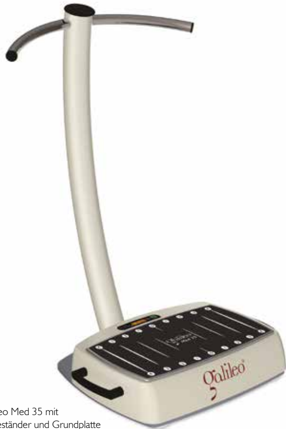
Galileo Med 35 mit Halteständer und Grundplatte

INTENSIVE EINZELTHERAPIE. THERAPEUT UND PATIENT IN DIREKTEM KONTAKT.