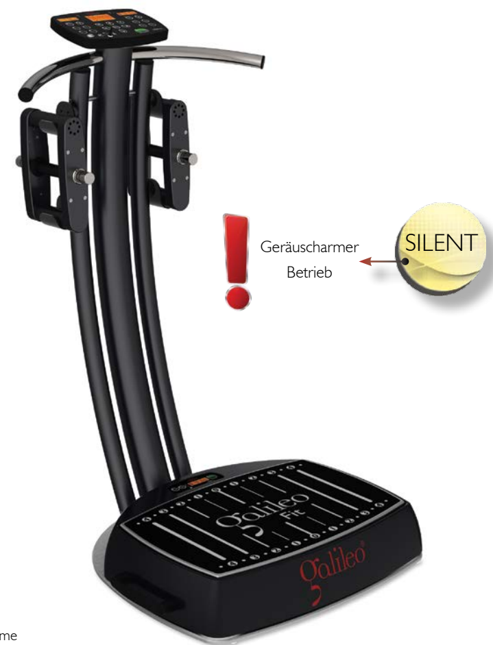
Galileo Fit Extreme