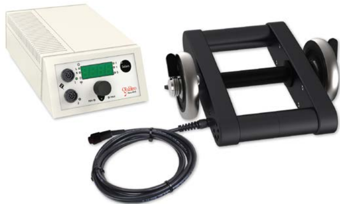
Galileo Mano 30 Hantel