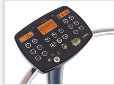
Bedienteil am Halteständer