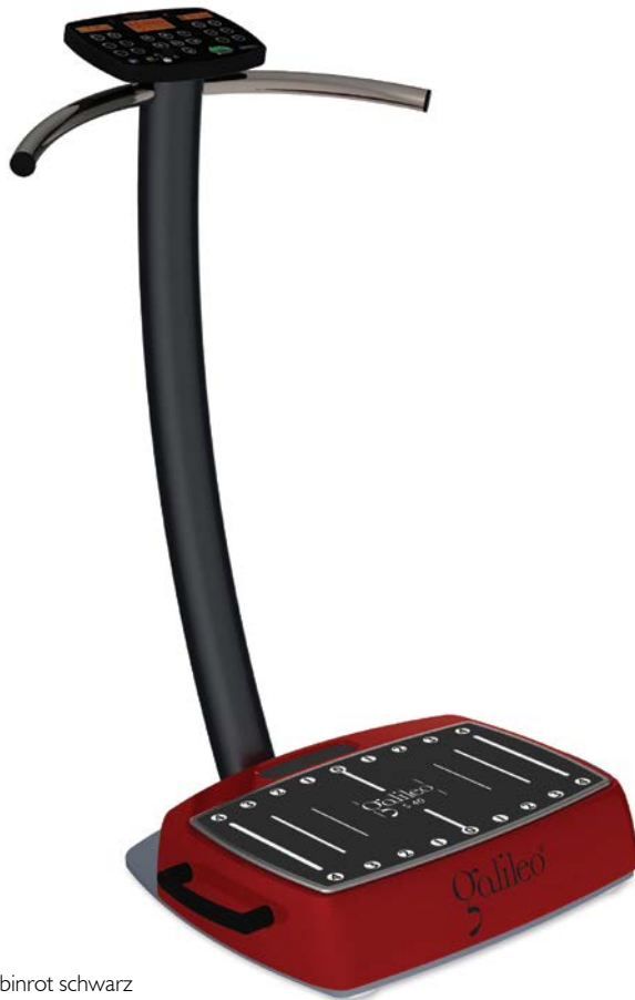
Galileo S 40 Plus in Farbvariante rubinrot schwarz