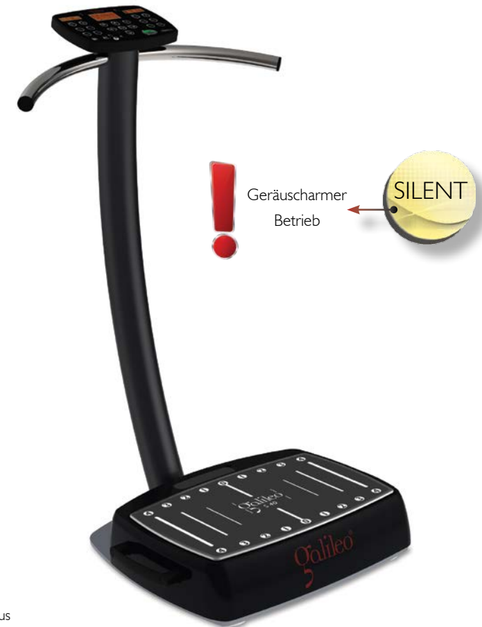
Galileo S 40 Plus