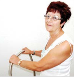
Training mit Haltebügel