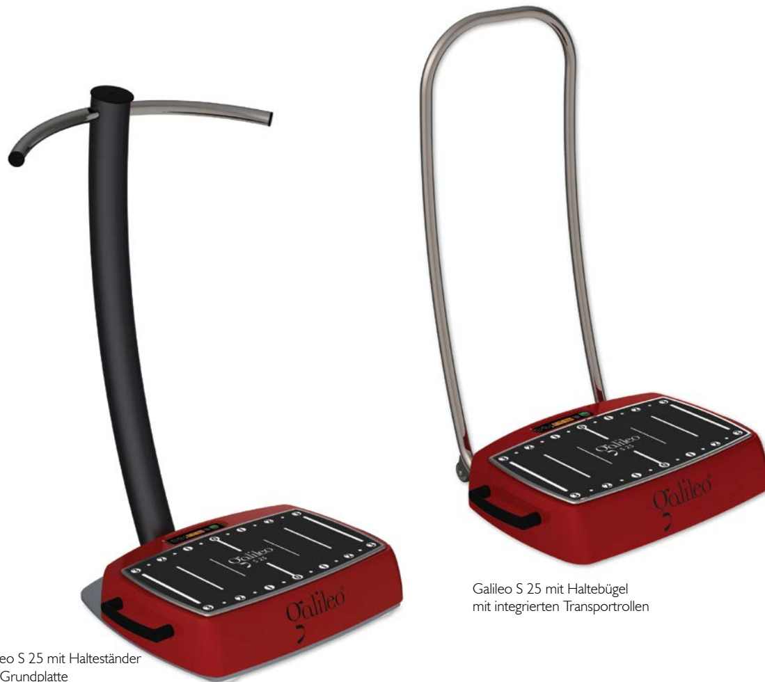
Galileo S 25 mit Halteständer und Grundplatte