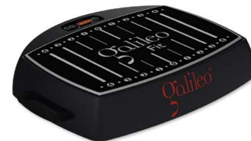
Galileo Fit Base