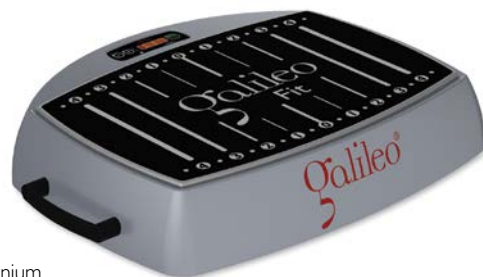
Galileo Fit Base in Farbvariante weißaluminium

FÜR DEN PROFIBEREICH OHNE HALTEBÜGEL. EINFACH ZU TRANSPORTIEREN.